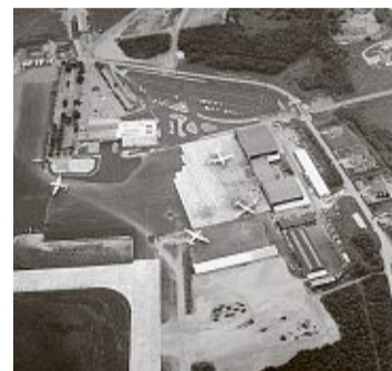
Vier grosse Flugzeuge auf dem Rollfeld: So klein war der Euro-Airport 1959.

Im Januar 2002 war es so weit: Der Name Crossair war