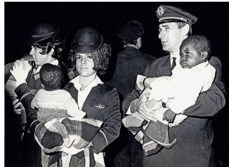
1971 kamen 80 geflüchtete Frauen und Kinder aus der Republik Biafra am Flughafen in Basel an.

Geschichte. Die Flugzeuge zeigten sich in neuem Gewand. Ein Airbus in Basel präsentierte das neue Swiss-Logo.