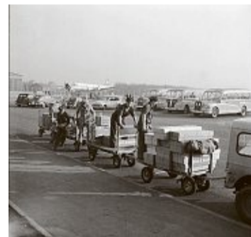
Einblicke in den Alltag von 1953: Ein Gepäcktransfer am Flughafen.