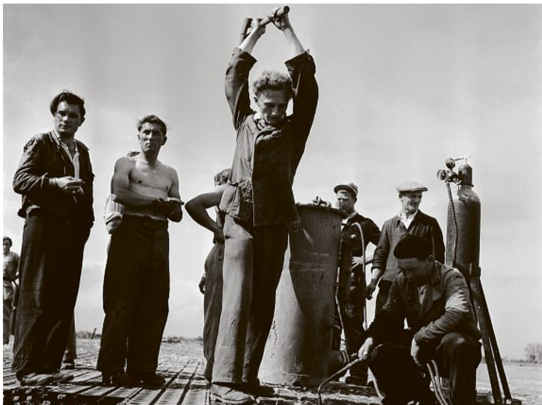
1946: Im April fanden die letzten Arbeiten statt: Die Start- und Landebahn wurden verlegt. Im Mai wurde der Flughafen Basel-Mulhouse dann schliesslich eröffnet.

Derweil stiegen die Passagierzahlen. Im Jahr 1956 wurden erstmals 100'000 Passagiere in einem Jahr verzeichnet. Das Wachstum ging in den folgenden 80 Jahren weiter: Im Jahr 2025 belief sich das Passagieraufkommen auf 9,6 Millionen Personen.